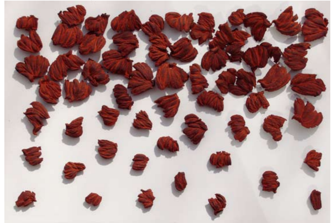
15 Expire - 2008 120 cm x 180 cm