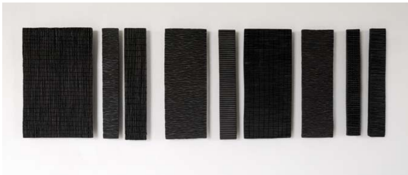
12 Séquence noire - 2009 Gravure - 26 cm x 90 cm