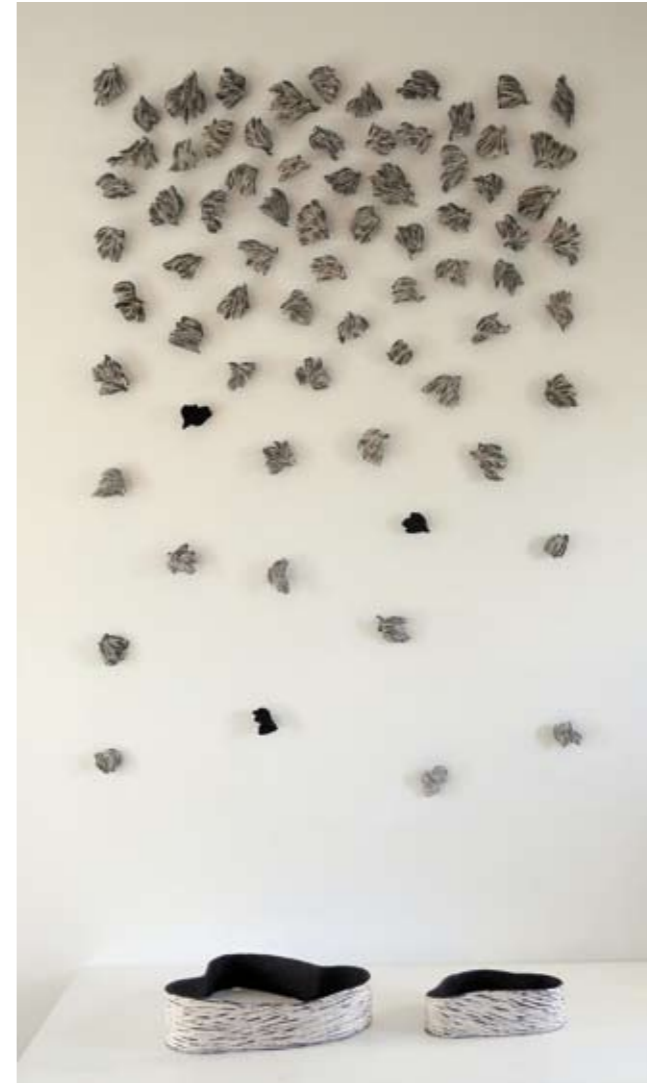
3 | Installation Inspire - 2010 Installation murale - 300 cm x 160 cm