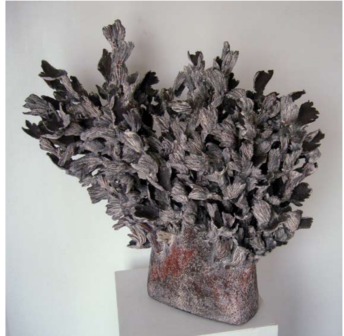
11 | Buisson grand vent - 2010 Terre modelée et engobes - 65 cm x 65 cm x 40 cm