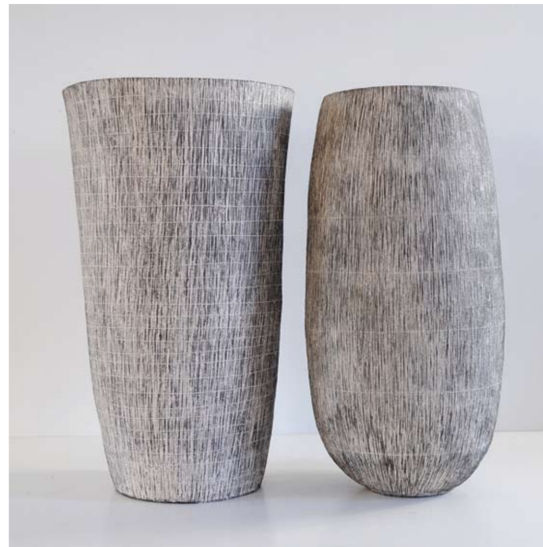
13 Pailles - 2008 Terre gravée - 60 cm x 36 cm - 60 cm x 24 cm