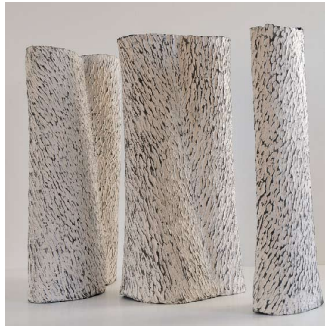
9 Mouvement - 2008 Terre gravée - 80 cm x 120 cm x 60 cm