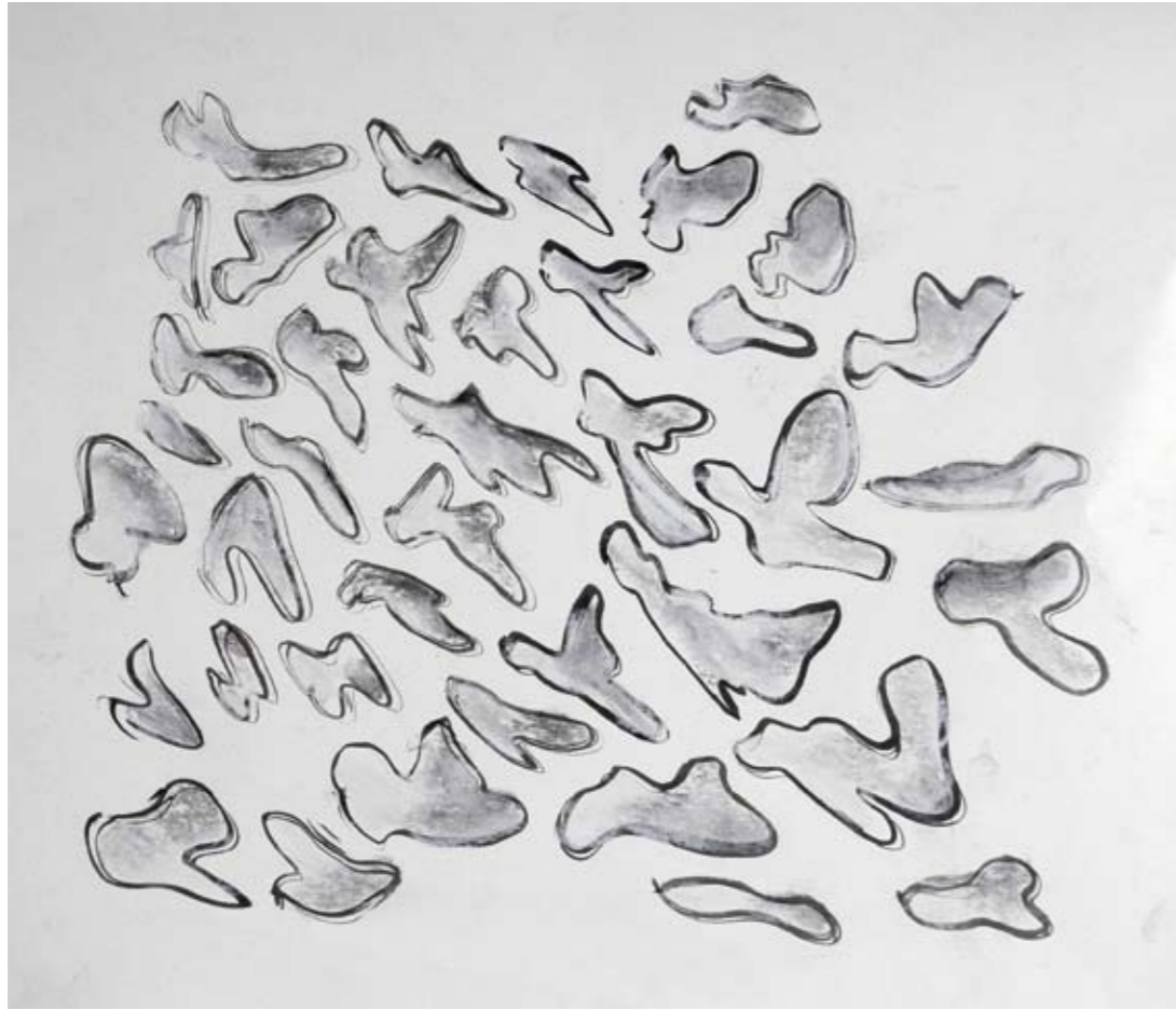
14 Étude - 2009 Encre - 28 cm x 35 cm