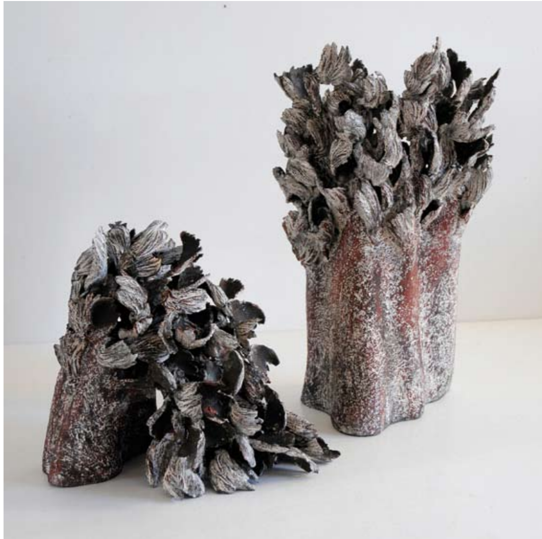
4 | Buissons modelés - 2010 Engobes - 30 cm x 30 cm x 40 cm - 50 cm x 35 cm x 30 cm