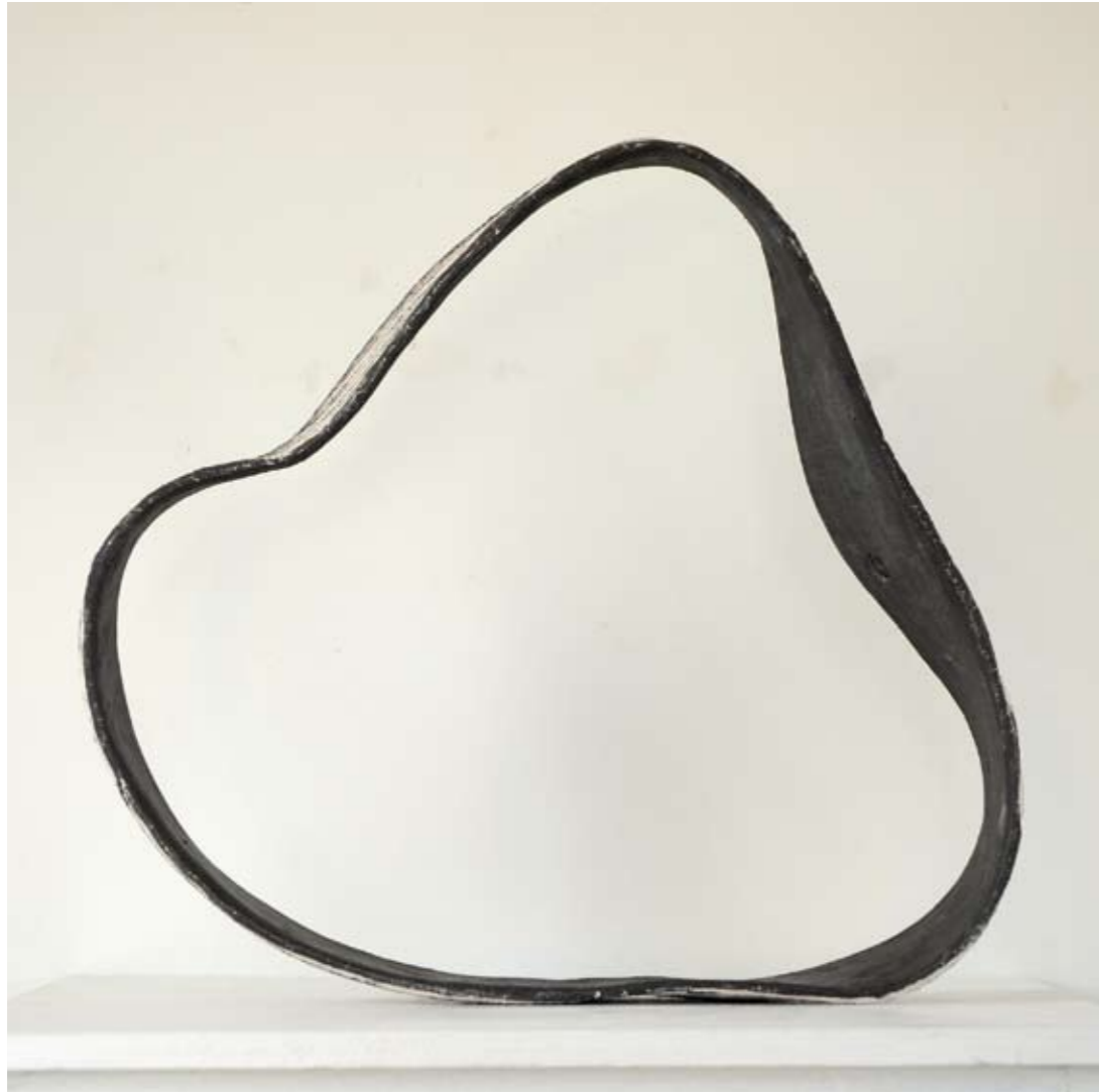
2 | Ruban - 2009 Terre modelée - 50 cm x 54 cm